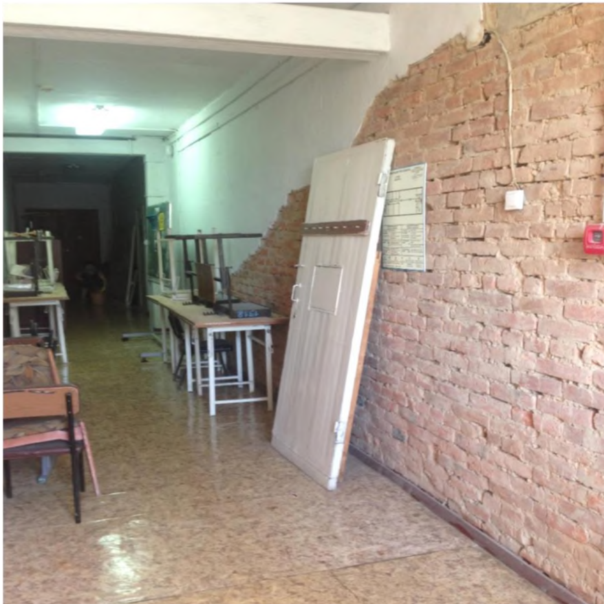
Фото после ремонта: