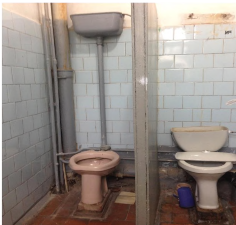
Фото после ремонта:

- ремонт санузла для обучающихся (3 этаж, здание «Б») Фото до ремонта: