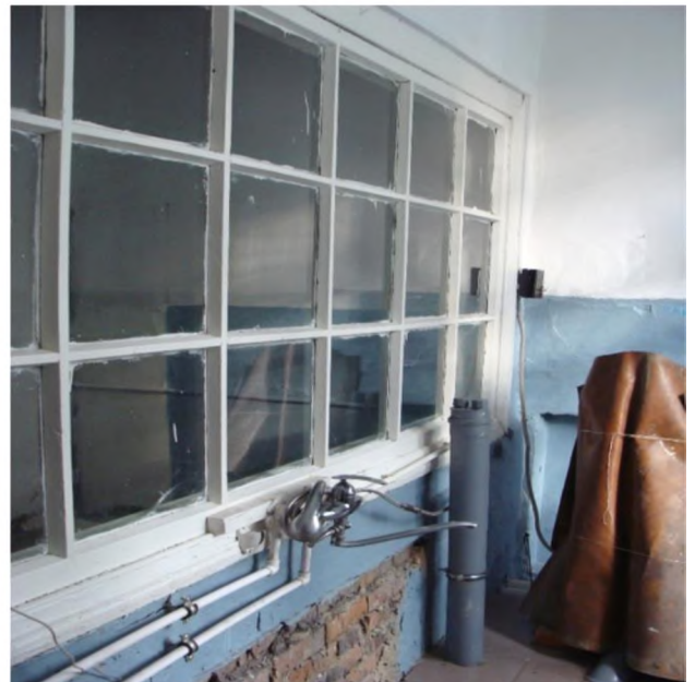
Фото после ремонта: