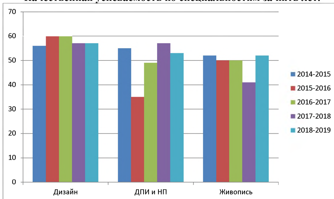
Качественная успеваемость по специальностям за пять лет.